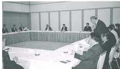
活発な意見交換が行われた三県連絡会議