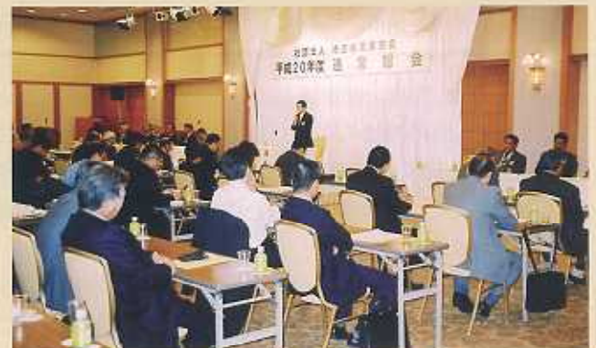
議案全てを承認した20年度総会