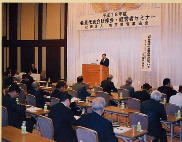
新会社法の基本的ルールを学んだ代表者研修会

平成18年度の代表者研修会・経営者セミナーが9月15日、雇用・能力開発機構埼玉センターの協賛を得て、さいたま新都心のブリランテ武蔵野で開催されました。