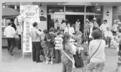
ちびっ子で賑わう当協会のブース

当協会は、今回も建設関連団体として唯一参加し、子供達に絶大な人気カードゲーム「遊戯王」と「デュエルマスターズ」を午前と午後の1回ずつ配布して、プレゼントされた子供達は、用意された部屋で早速対戦相手とゲームを開始していました。