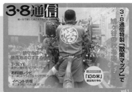
鳩ヶ谷地域情報紙「3・8通信」

近年、鳩ヶ谷も様変わりしました。地下鉄南北線の埼玉延伸で、2つの駅もでき、都心へ30分で行けるようになり