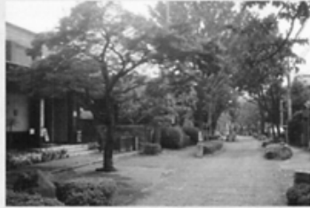
かえで通りと漫画会館

この地は日本屈指の盆栽郷として知られ、四季折々の樹景は美しく、訪れる人の心をなごませます。盆栽村が誕生したのは関東大震災の後、東京より数軒の盆栽業者が移り住み、盆栽を育成したのが始まりと言われ、その後、盆栽を業とする人々が増えて盆栽村を形成したそうです。