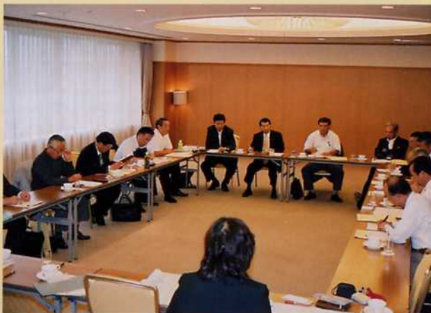
セミナーに先立ち開かれた第7回理事会

また、セミナーに先立ち今年度7回目の理事会が開催され、通常会員の入会、(10月開催の)三県(埼玉・神奈川・千葉)連絡会議への提出議題、国交省関東地方整備局を講師にお招きしての「総合評価方式」講習会、埼玉県との意見交換会——などの議案を審議し、すべてが了承されました。