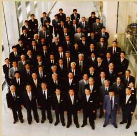
更なる発展を誓い当協会会員一同の全員写真