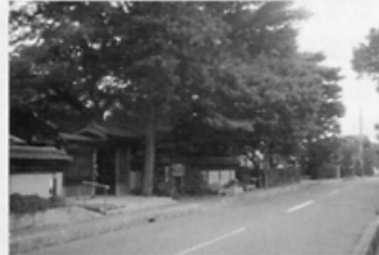
もみじ通りと盆栽四季の家

るのが「さいたま市立漫画会館」。近代漫画の先駆者で、地元出身の北澤楽天の偉業を記念し、風刺画等の漫画文化を紹介する漫画専門館です。もみじ通りは、明るく開けた静かな通りで、ここにあるのが盆栽四季の家。四季の道の散策や盆栽園を訪れた人のくつろぎの場で、茶会などに利用できる和室や休憩室も備えた、純和風の風景に溶け込んだ建物です。かえで通りやもみじ通りの街灯は、風景を壊さぬ様に、柱に木の角柱を使用しています。